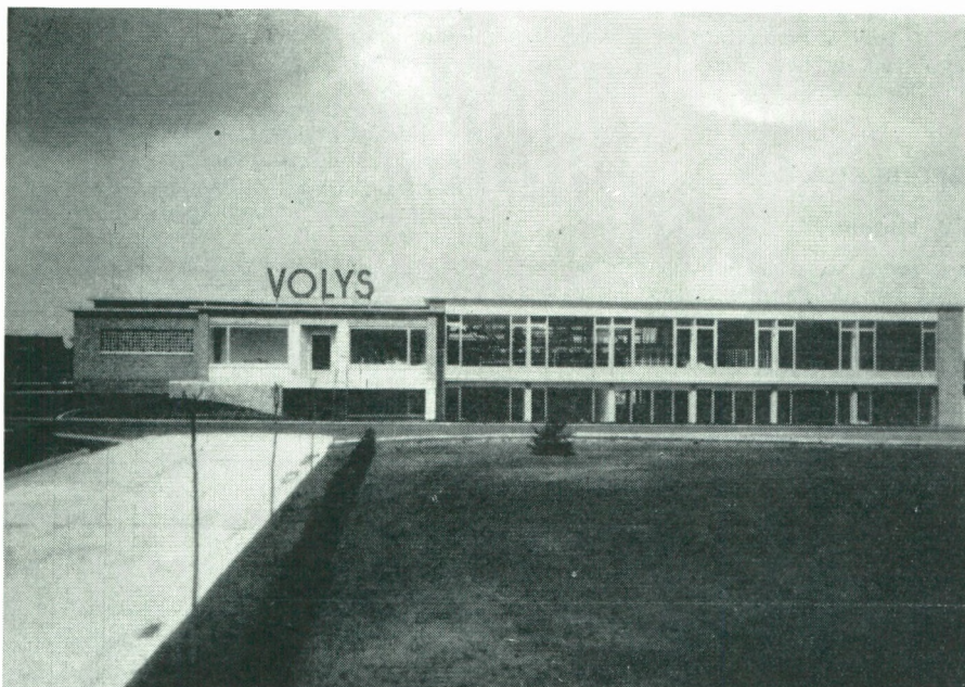
Bedrijfsgebouw P.V.B.A. Gebr. Dewulf, Lendelede.