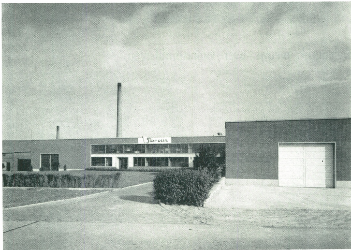
Fabrieksgebouw Fibrolin, Wielsbeke.

De firma stelt in 1963 een 85-tal arbeiders tewerk. Het gebouwencomplex heeft een oppervlakte van 16.000 m 2 .