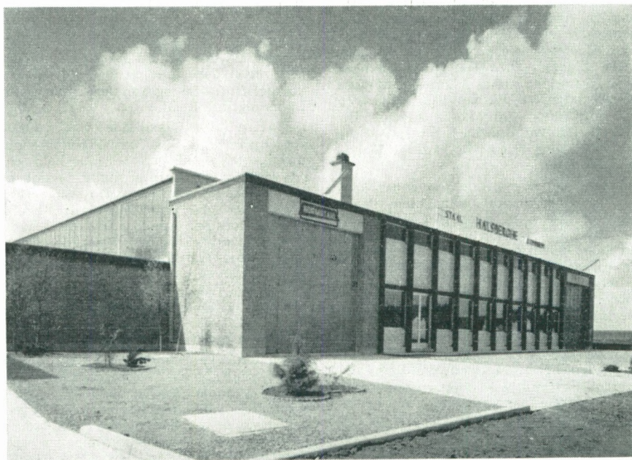
Bedrijfsgebouw Gebr. Halsberghe, Kuurne.

Dit alles laat nog een verdere snelle uitbreiding voorzien.